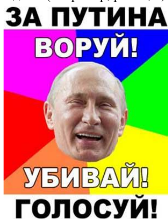
Рис. 4. Ценностно-эмоциональное манипулирование

тенциал прецедентных феноменов с точки зрения реализации воздействия на сознание молодежной аудитории в разных технологиях. Среди них мы выделяем: мифологическое манипулирование, манипулятивные психотехнологии, ценностно-эмоциональное манипулирование, использование механизмов социального контроля, манипулирование рациональными, убеждающими аргументами . Прецедентные визуальные образы часто эксплицируют информацию, не передаваемую вербальной составляющей, активизируют образное ассоциативное мышление адресата, способствуют усилению сопереживания и переживания, оказывают существенное влияние на сознание, а также необходимым для адресанта образом моделируют картину мира современной молодежи (например, рис. 4, 5).